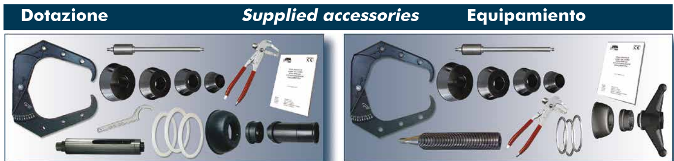
B 335 C Evo - B 235 C Evo