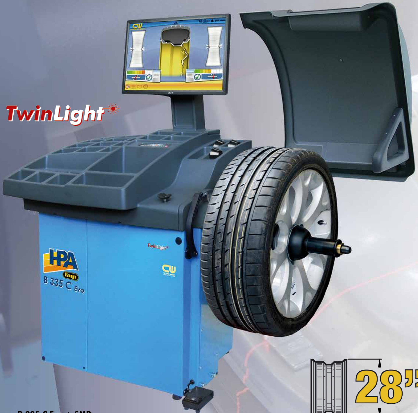
B 335 C Evo + SMD