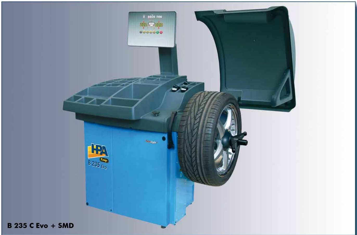
B 235 C Evo + SMD

Equilibratrice ad alte prestazioni a doppio display. High performance wheel balancer with double display. Equilibradora a elevada prestación con doble pantalla.